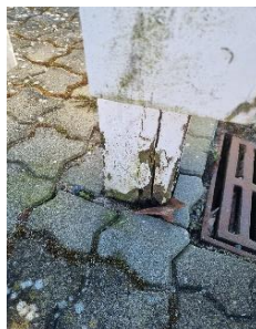
Udskiftning af hegn i 2023