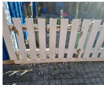
Udskiftning af hegn