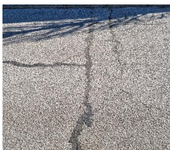
Delreparation af asfalt i 2023