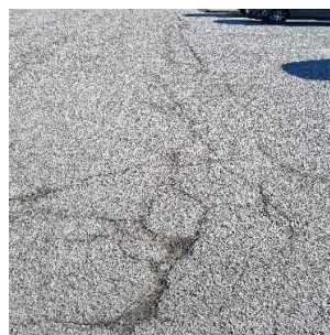
Delreparation af asfalt