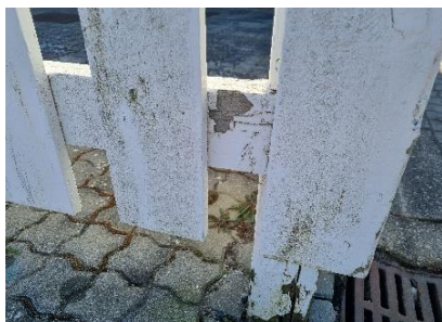
Udskiftning af hegn