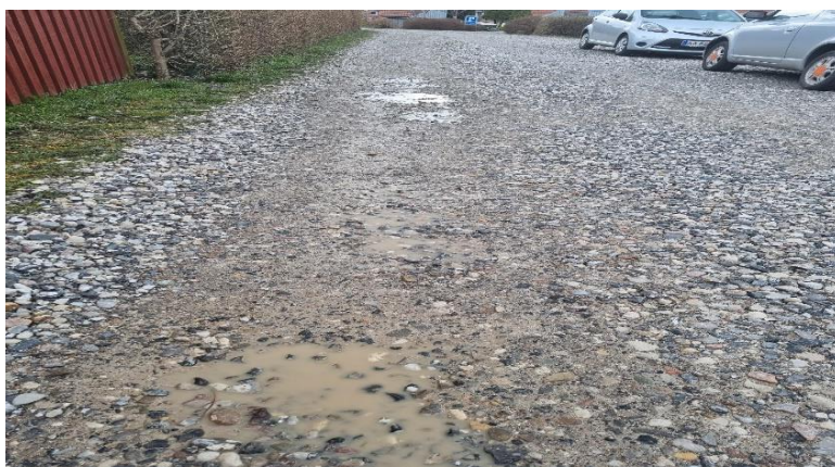
Etablering af ny belægning på privat fællesvej