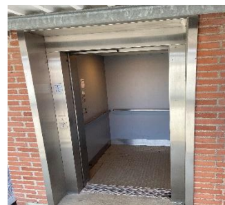
Renovering af elevatorer