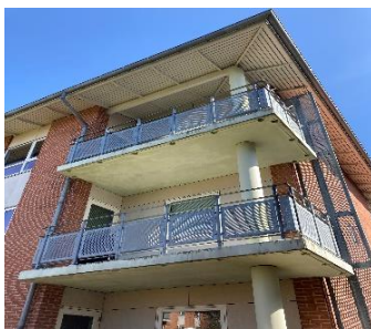
Maling af altaner