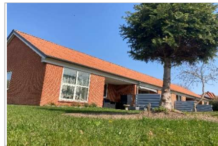
Maling af hegn