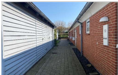
Maling af skure

En del af huslejen går til afdelingens opsparing, som bruges på planlagte vedligeholdelsesopgaver. Afdelingsbestyrelsen har sammen med DOMI Bolig gennemgået vedligeholdelsesplanen, som er en del af budgettet. Vi gennemgår også planen på afdelingsmødet, men her kan du se nogle af de opgaver, der bliver lavet i 2024.