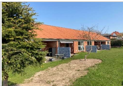
Maling af hegn