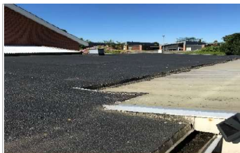
Tagpap på garager skiftes.

En del af huslejen går til afdelingens opsparing, som bruges på planlagte vedligeholdelsesopgaver. Afdelingsbestyrelsen har sammen med DOMI Bolig gennemgået vedligeholdelsesplanen, som er en del af budgettet. Her kan du se nogle af de opgaver, der er prioriteret i 2025: