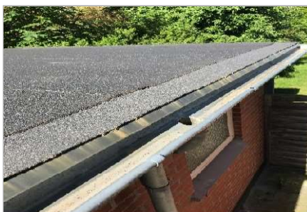
Tagpap på garager skiftes.