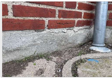
Reparation af sokkel og fundament.