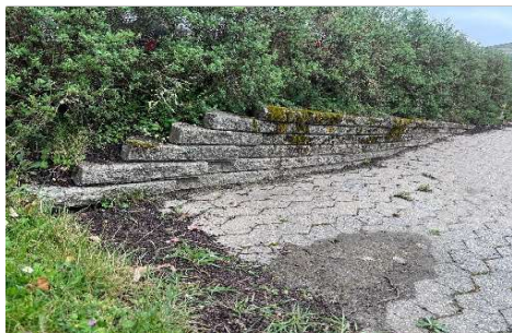
Reparation af plantestensvæg.