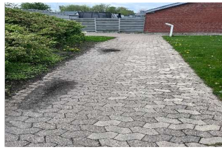
Udskiftning af belægning på stier.