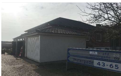
Renovering af garage