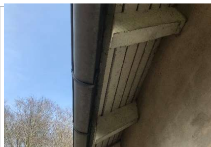
Maling af udhæng