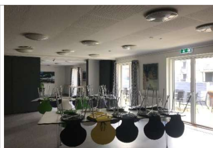
Maling af fælleshus, gæsteværelser og gardarrobe