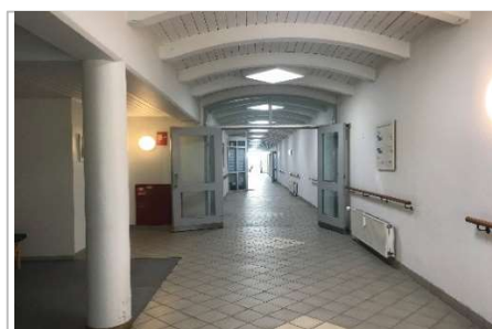
Maling af fællesgang