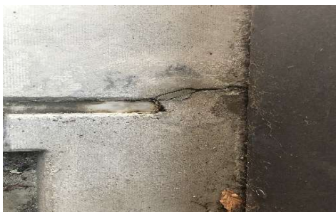
Udbedring af silikonefuger og beton i svalegang

En del af huslejen går til afdelingens opsparing, som bruges på planlagte vedligeholdelsesopgaver. Afdelingsbestyrelsen har sammen med DOMI Bolig gennemgået vedligeholdelsesplanen, som er en del af budgettet. Her kan du se nogle af de opgaver, der er prioriteret i 2025.